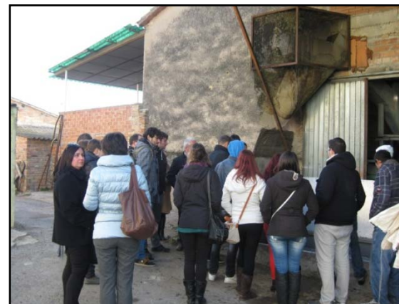
Molí d'en Pau (Noguera)