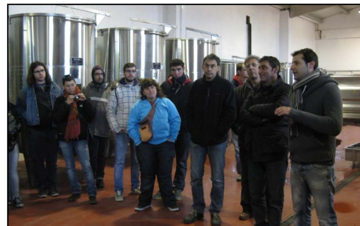
Viver de Celleristes (Conca de Barberà)