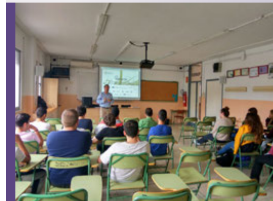
Taller ODISSEU a l'INS Montsià d'Amposta (Consorci per al Desenvolupament del Baix Ebre i Montsià)