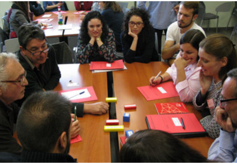
Jornada de Networking a Flix entre joves i empreses (Consorci Intercomarcal d'Iniciatives Socioeconòmiques)

Projecte pel retorn de joves al món rural